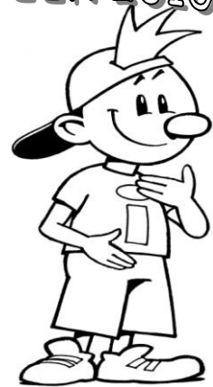
“Stel je voor”

De vakantie-bijbel-spelweek! Het komt in zicht! Met behulp van de beide kerken is het ons toch weer gelukt om deze week te organiseren. Zoals bekend vindt de vakantie-bijbel-spelweek de laatste week van de zomervakantie plaats. Dit jaar is dit van dinsdag 10 augustus tot en met vrijdag 13 augustus. Zoals je hiernaast kunt zien is het thema dit jaar “STEL JE VOOR” .