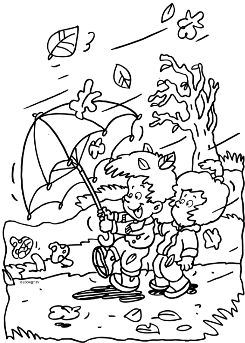
Herfst – wind en regen