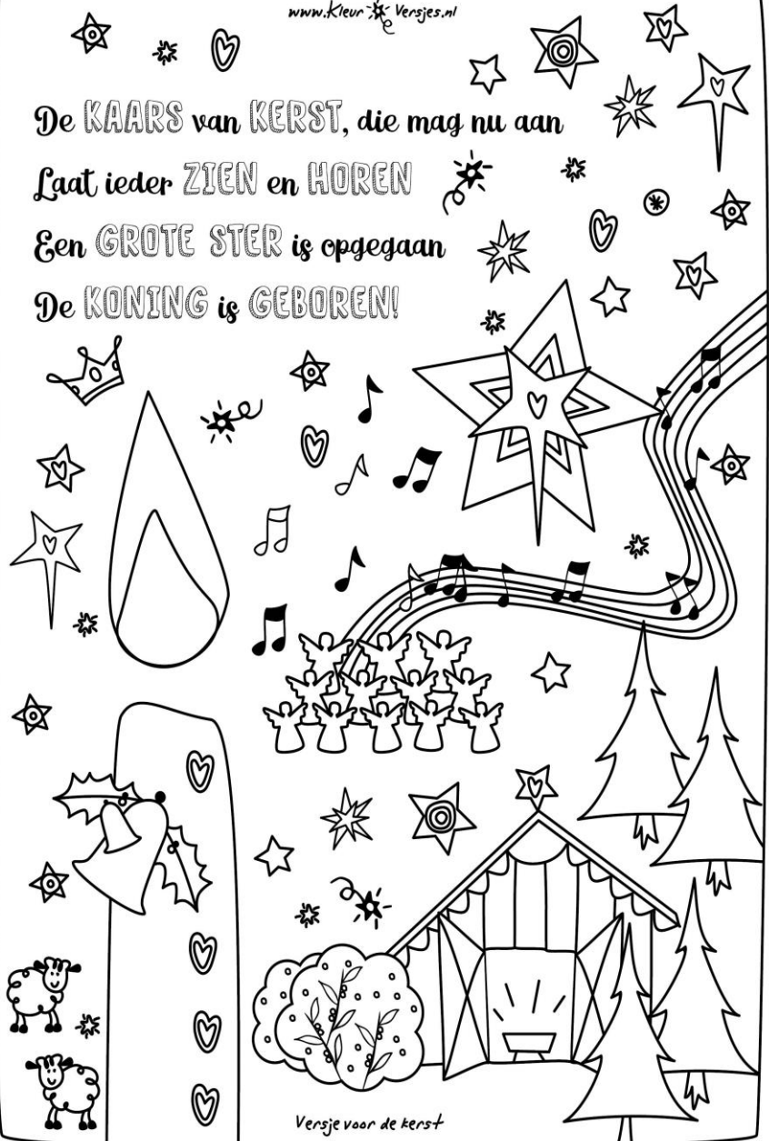
Versje voor de kerst

De KAARS van KERST, die mag nu aan Laat ieder ZIEN en HOREN Een GROTE STER is opgegaan De KONING is GEBOREN!