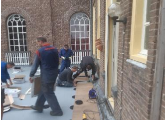
En uitgerust verder konden.