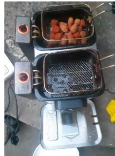
En een gepaste ‘ beloning’.

Een groep vrijwilligers heeft vorige week de handen flink uit de mouwen gestoken. Met vereende krachten werden eerst de betonnen tegels van het dakterras van de pastorie gehaald en afgevoerd. De ‘bezemploeg’ kwam er gelijk achteraan om het dak schoon te spuiten en te vegen, waarbij de zachtjes neerdalende regen eigenlijk best goed van pas kwam. Zeker toen die regen ook weer ophield!