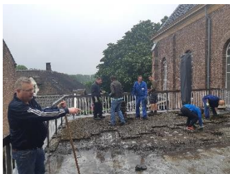
Toen gingen vrijwilligers aan de slag