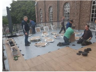
Ze werkten gestaag door.