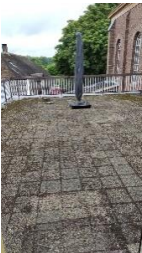
Zo was het.