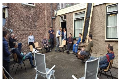
Die ook even pauzeerden.